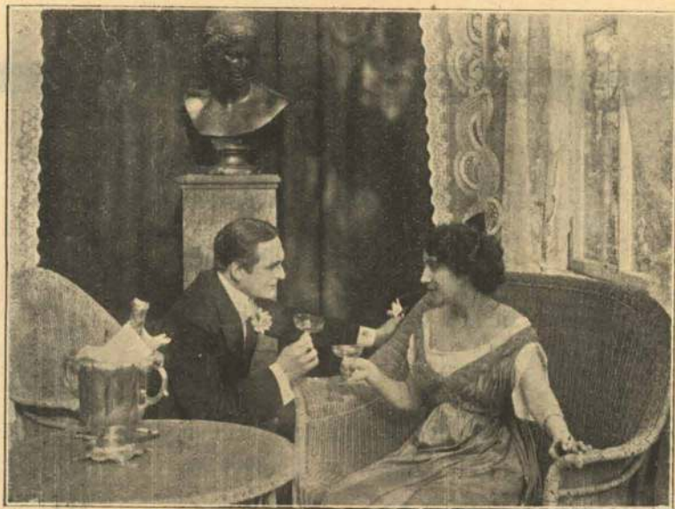
Frk. Helga og den fremmede Officer.

R igdom — Elegance — Ynde — Skønhed . . . alt, hvad der er fint og fornemt, og alt, hvad der har Glans og Klang efter det røde Guld, er samlet i Højsæsonen her paa det store, mondæne —ske Badehotel — et verdens-