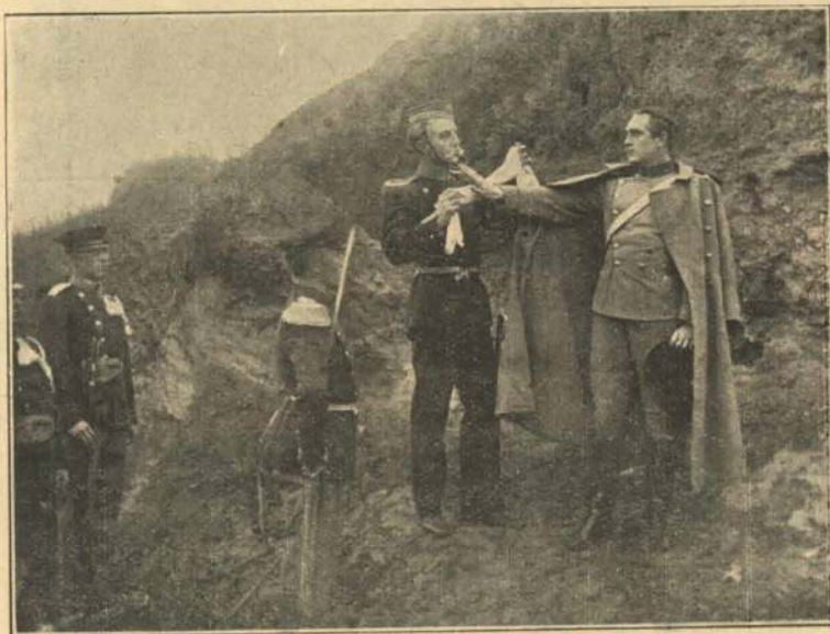
„Nej — intet Bind for Øjnene!“

I den nærmeste Omegn af Frk. Helgas Hjemstavn er de militære Forberedelser særlig livlige. Man venter, at det just paa disse Kanter af Landet skal komme til et vældigt Sam-