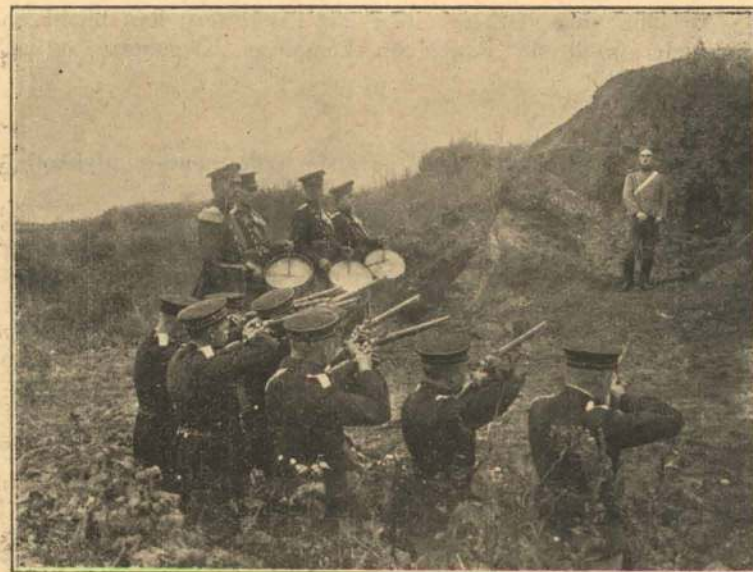
„Giv agt — fyr!“

Men — da nu det Øjeblik kommer, da hun paa ny staar Ansigt til Ansigt med hin unge Officer, da taler Kærligheden med eet saa stærkt og bydende til hende, at hun vover sig til et skæbnesvangert Skridt: for at redde den Mand, der trods alt fejler hendes Hjærte, hjælper hun ham til at flygte.